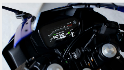
Tableau de bord TFT 5 pouces inspiré de la R1

Le tableau de bord TFT couleur de 5 pouces inspiré de la R1 vous fournit des informations claires. Ce niveau d'équipement exceptionnel renforce le caractère haut de gamme de la R125. Sélectionnez l'un des thème « Street » ou « Track » selon la situation de pilotage et ajustez facilement le témoin de changement de vitesse programmable et la plage du compte-tours par incréments de 200 tr/min en fonction de votre style de pilotage et de vos préférences.