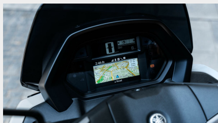
Tableau de bord TFT connecté de 4,2 pouces

Le NMAX 125 Tech MAX est équipé d'élégants feux arrière à LED, ainsi que de clignotants à LED intégrés qui confèrent à ce scooter urbain sportif une allure dynamique et contemporaine.